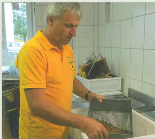
Das zerkleinerte Wabenmaterial wird mit dem mitgelieferten Sieb gereinigt.