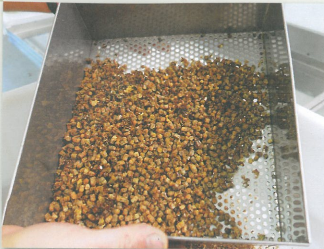
Das bereits sehr saubere Bienenbrot wird nochmals im gefrorenen Zustand in den Bee Bread Harvester geleert, um noch eventuelle Wabenzellen vom Pollen zu entfernen.