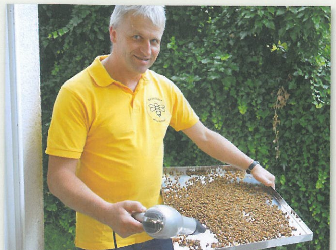
Das Bienenbrot/Perga wird auf eine große Wanne geschüttet. Mit dem Föhn werden einzelne Wabenteile und Wachsteile verblasen.